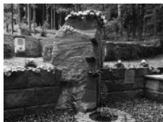
Unsere „Quelle des Naturheilbundes“ wurde im Juni 2015 unter Beteiligung einer großen DNB-Reisegruppe eingeweiht.

Tausende Besucher kuren und wandern jährlich in den gepflegten Anlagen und nutzen den modernen Balneopark (Natur-Wassergarten). Die Wasser-, Licht- und