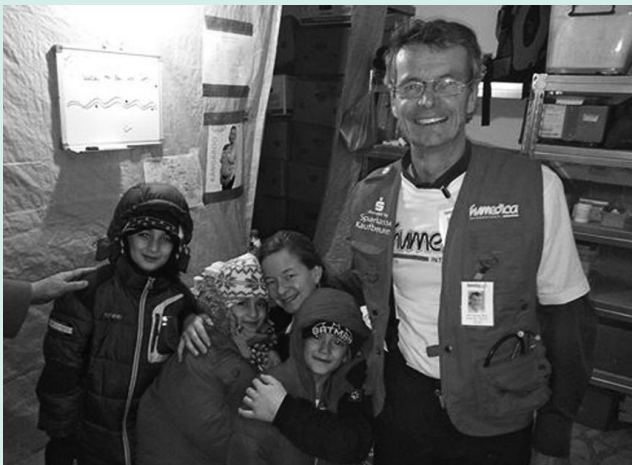
Flüchtlingshilfe in Miratovac Serbisch- mazedonische Grenze vor Weihnachten 2015